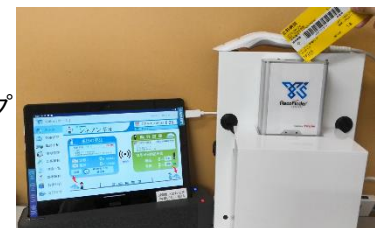
オンライン型 SPD カード回収ボックス

*SCM (Supply Chain Management)：自社内あるいは取引先との間で受発注や在庫、販売、物流などの情報を共有し、原材料や部材、製品の流通全体の最適化を図る管理手法。