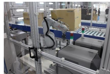
コンベアー一体型 RFID 自動貼付ロボ

また、RFID タグを使ってすべての医療材料を管理することで、グループ内において統一されたマスタでデータ管理をすることができ、医療材料の入荷からその医療材料が使用されるまでのモノの動きを大阪 SC を起点として紐づけることが可能となります。このような取り組みを通じ、当社グループは医療材料管理における SCM*（サプライチェーンマネジメント）実現へも貢献してまいります。